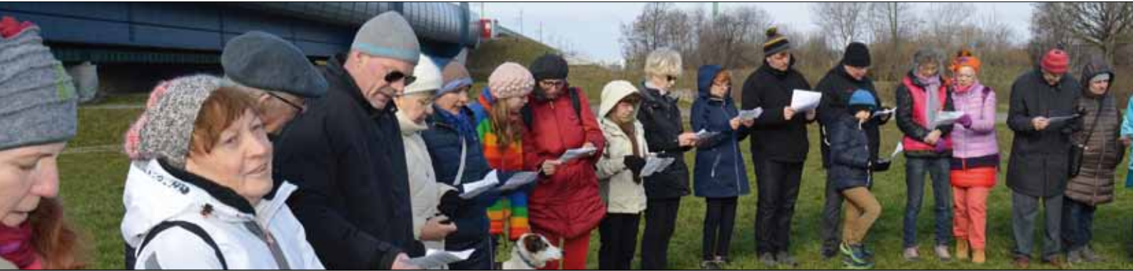
Ostermontag - Gemeinsamer Emmausgang nach Stattersdorf