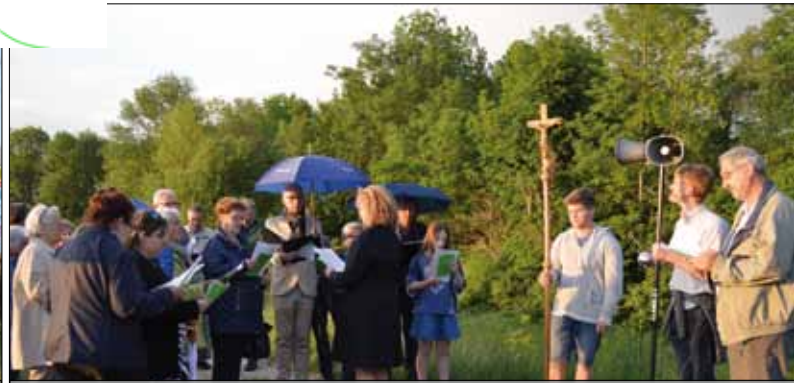
Feldersegnung mit dem Kirchenchor