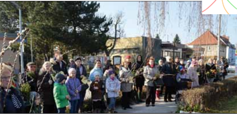
Palmsonntag in Spratzern