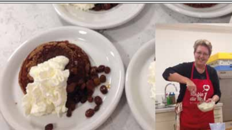
10 Jahre „Vergnügliches Kochen“ Kulinarische Leckerbissen mit Erfolgsgarantie für unsere Kochfreudigen.