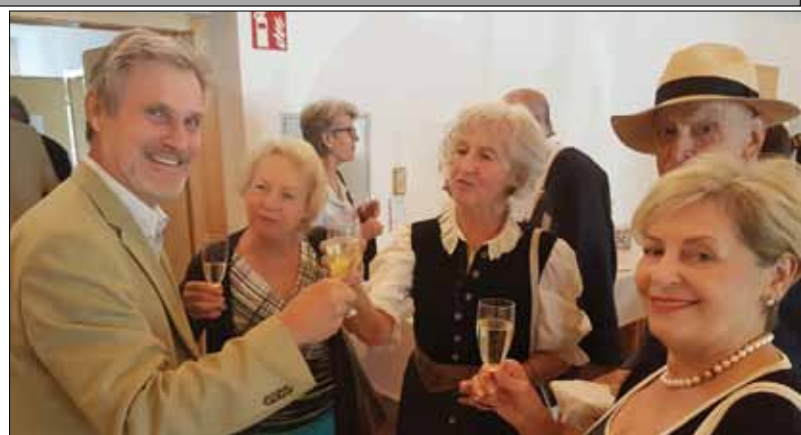
Pfingsten in Kapistran wir stoßen auf den Geburtstag der Kirche an